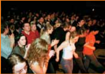
Jakaś lewa publika