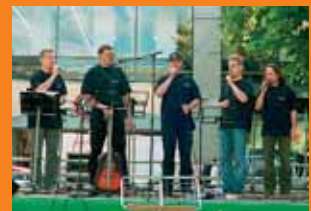
Segars - nieobecni, usprawiedliwieni