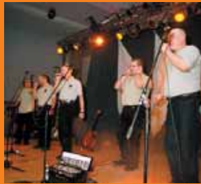
Perty A Łotry?