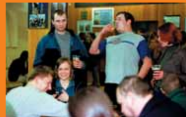
W festiwalowym pubie...