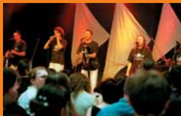
Sąsiedzi od frontu