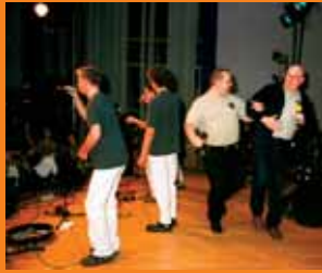
Za plecami Sąsiadów