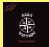
„Korsarska brać” - RÓŻA WIATRÓW