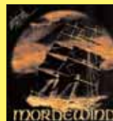
„Fala” - MORDEWIND