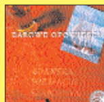
„Barowe opowieści” - GDAŃSKA FORMACJA SZANTOWA