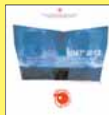
„Burza. Dekada Łotrów” PERŁY I ŁOTRY