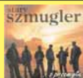
„...z przemytu” STARY SZMUGLER

tu jest trochę inaczej. Nie da się bowiem na płycie oddać tego, co Banany wyprawiają na scenie. Dlatego płyta jest bardziej do słuchania niż do skakania. Z lampką wina, przy kominku, nastrojowo... polecam.