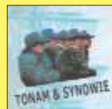
„Składanka” TONAM & SYNOWIE